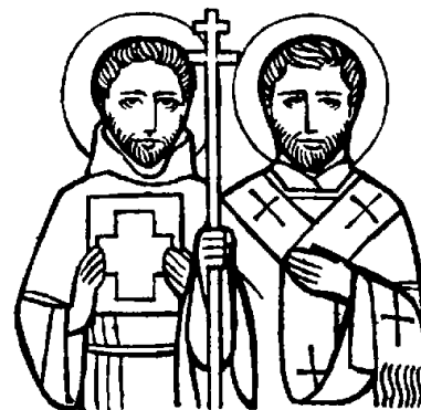
sv. Cyril a sv. Metod

V tomto mesiaci si opäť pripomenie slávnosť sv. Benedikta – patróna Európy. Jeho heslom bolo: Modli sa a pracuj. Vystihol ducha našej kultúry – potrebujeme činnosť, aktivitu, ale aj sústredenie, vhlbenie sa. To „modli sa“ môže mať rôzne podoby. Môže to byť aj uvedomenie si ťažkostí a krízov života a pritom načerpanie pokoja. Jednoducho získanie nadhľadu a sily.